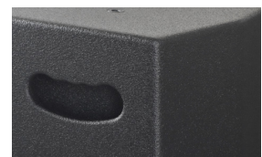
Ergonomisch geformte Griffausfräsung in der Rückwand für den bequemen Transport.