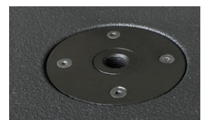
Die M20 Flanschplatte dient zur Aufnahme einer Verlängerungsstange für ein Topteil.