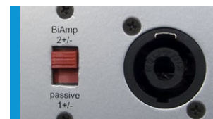
Mit zuschaltbarer Frequenzweiche.