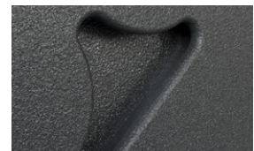
Große Griffausfräsungen für ein bequemes Handling .