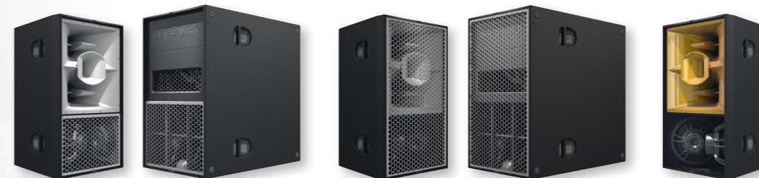
Partial Grille Option